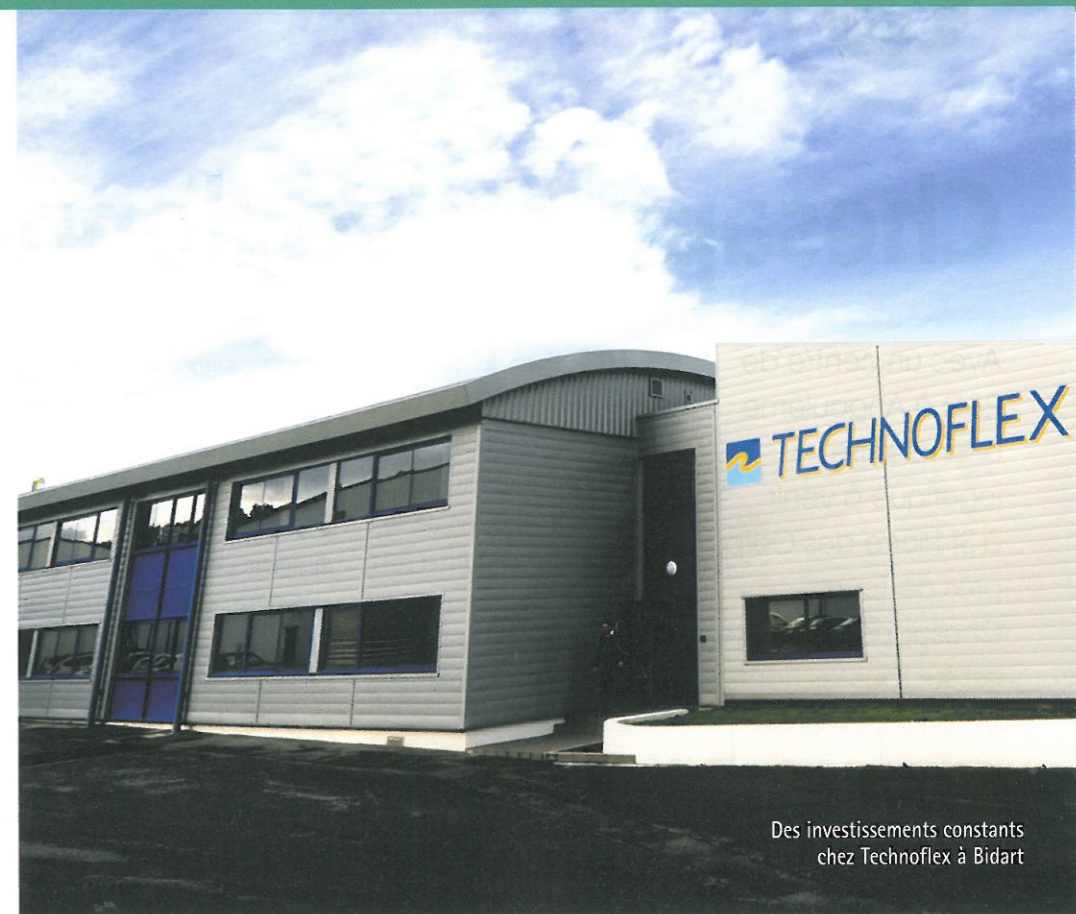
Des investissements constants chez Technoflex à Bidart

Les projets de manquent pas. L'entreprise travaille déjà sur les prochaines générations d'Inerta et sur la spécificité de ses films avec des propriétés barrière améliorées. L'attention se porte sur de nouvelles gammes multicouches qui nécessitent plus de travail en amont pour minimiser les interactions entre la poche et le médicament. Autres axes : des kits de connectique qui permettent un accès d'injection sur une poche, des sets de transfert Inerta pour la reconstitution sans ai-